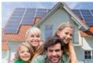
VERBUND Eco-Solar: Sonnenschein im smarten Heim.