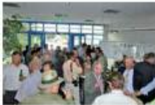
Ein Blick hinter die Kulissen der Stromerzeugung bei den Kraftwerksführungen.