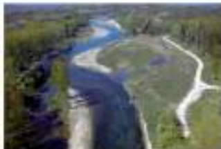
Wissenswertes rund um die neugeschaffene Traisental-Mündung.