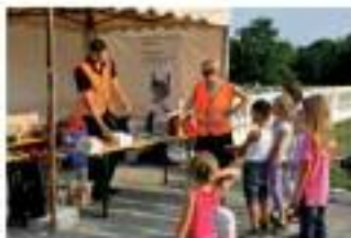
Unterhaltungsprogramm mit dem Physikmobil zum Staunen für Jung und Alt.