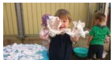
Ein Blick in die Betreuung unserer Kleinsten.