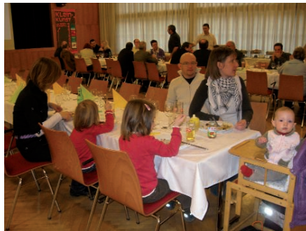
Herzlich Willkommen - hieß es auch heuer wieder für alle neuen GemeindegängerInnen, die im letzten Jahr zugezogen sind.