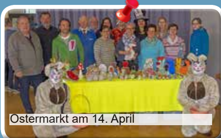
Ostermarkt am 14. April