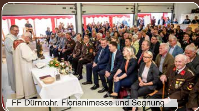
FF Dürnrohr. Florianimesse und Segnung