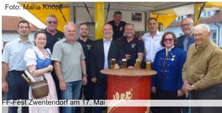
FF-Fest Zwentendorf am 17. Mai