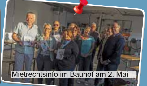
Mietrechtsinfo im Bauhof am 2. Mai

Schönheit X3 Kosmetik-Gesundheit-Energie