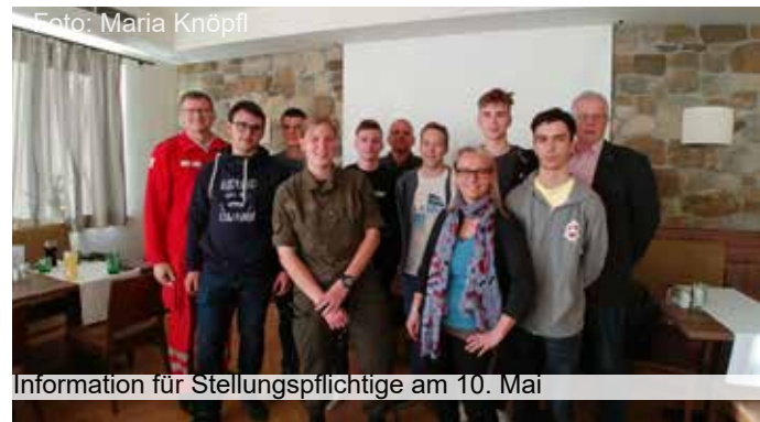
Information für Stellungspflichtige am 10. Mai