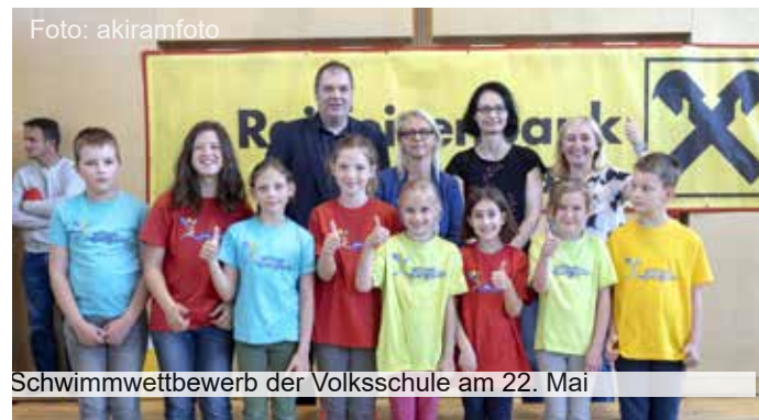
Schwimmwettbewerb der Volksschule am 22. Mai