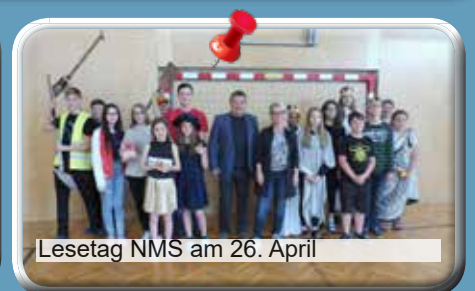
Lesetag NMS am 26. April