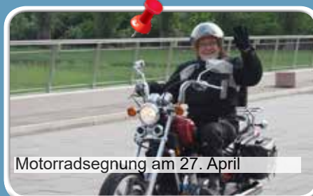
Motorradsegnung am 27. April