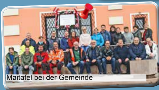
Maitafel bei der Gemeinde