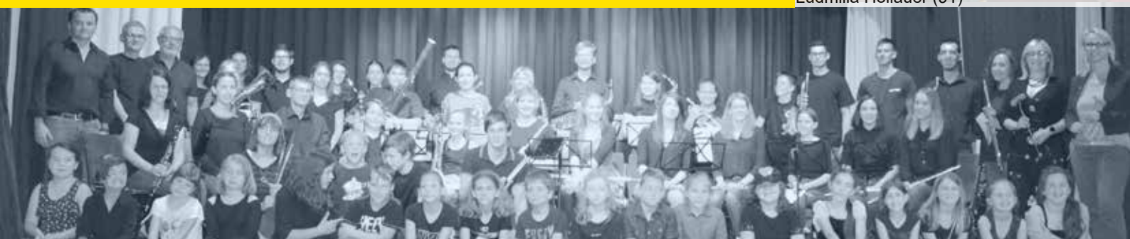
10 Jahre „Music & Dance Factory Zwentendorf“-Jubiläum am 26. Mai