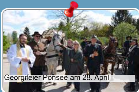
Georgifeier Ponsee am 28. April