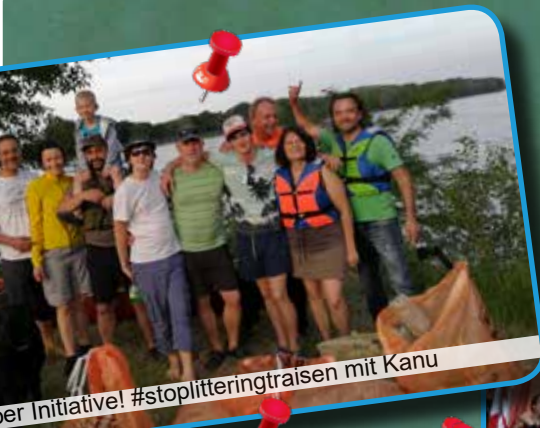
er Initiative! #stoplitteringtraisen mit Kanu