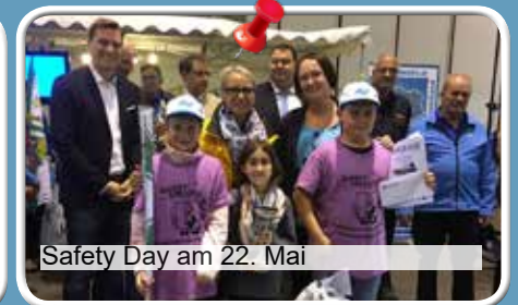
Safety Day am 22. Mai