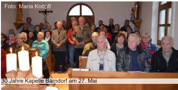
30 Jahre Kapelle Bärndorf am 27. Mai