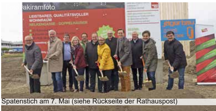
Spatenstich am 7. Mai (siehe Rückseite der Rathauspost)