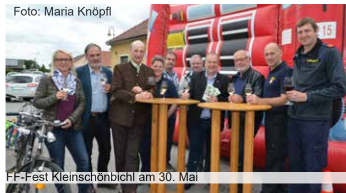
FF-Fest Kleinschönbichl am 30. Mai