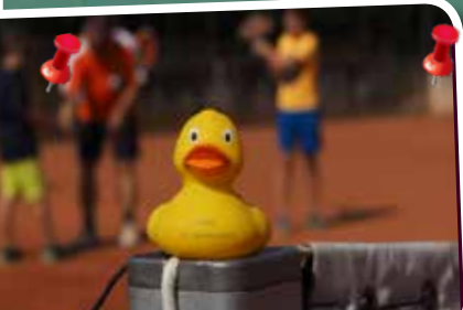
derferienspiel. ogramm auf zwentendorf.at