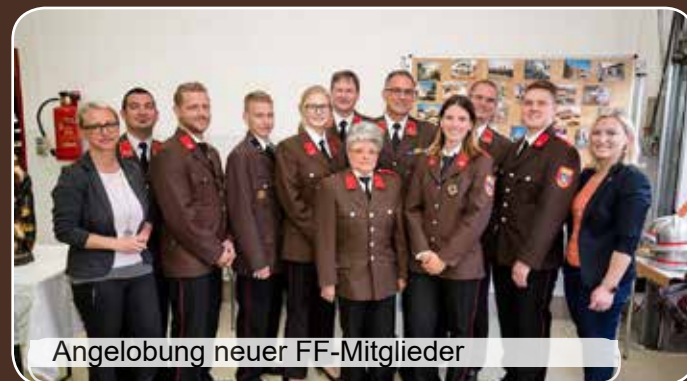
Angelobung neuer FF-Mitglieder