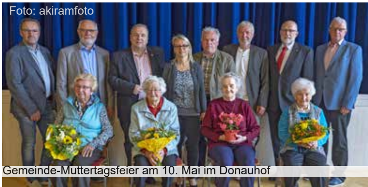
Gemeinde-Muttertagsfeier am 10. Mai im Donauhof