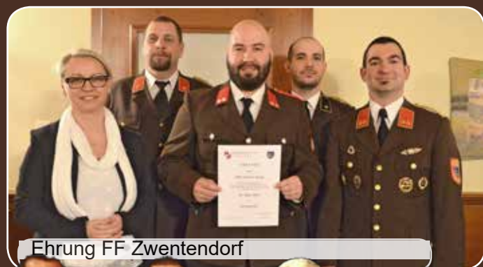
Ehrung FF Zwentendorf