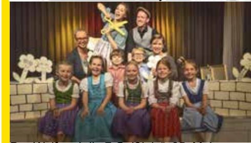
„Der Wolf und die 7 Geißlein“. 25. Mai