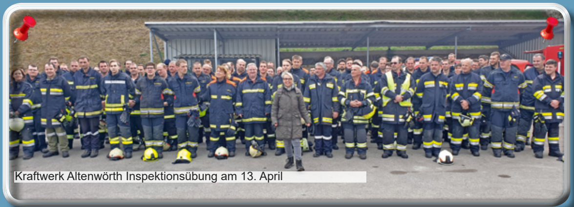
Kraftwerk Altenwörth Inspektionsübung am 13. April