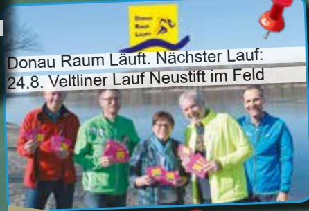
Donau Raum Läufe. Nächster Lauf: 24.8. Veltliner Lauf Neustift im Feld