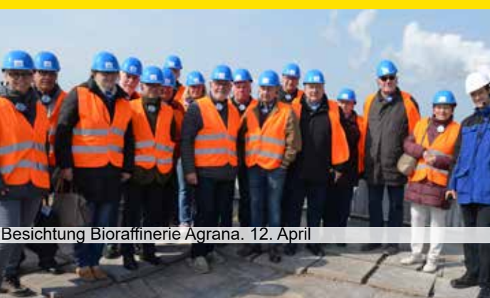
Besichtigung Bioraffinerie Agrana. 12. April