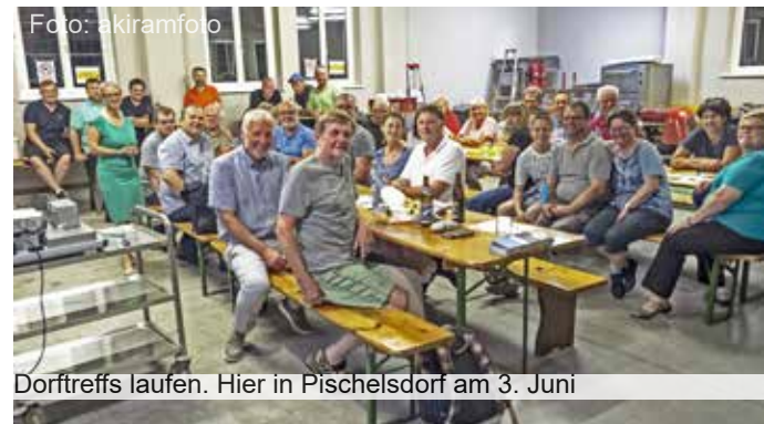
Dortreffs laufen. Hier in Pischelsdorf am 3. Juni