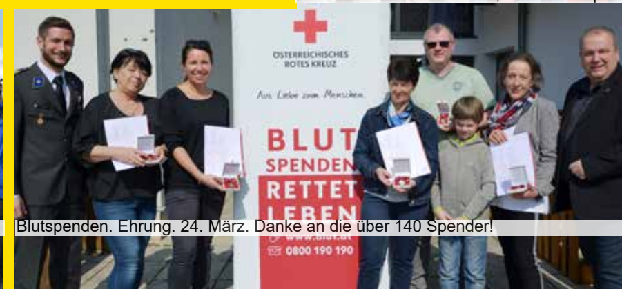
Blutspenden. Ehrung. 24. März. Danke an die über 140 Spender!