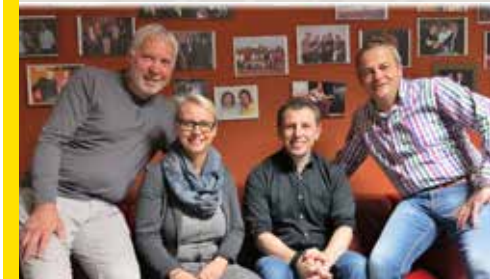
Kleinkunstabühne Donauhof, Kosch. 13. April