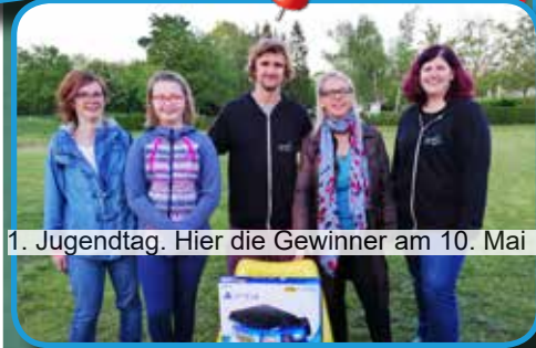
1. Jugenttag. Hier die Gewinner am 10. Mai