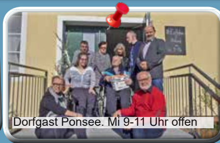
Dorfgast Ponsee. Mi 9-11 Uhr offen