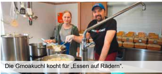
Die Gmoakuchl kocht für „Essen auf Rädern“.

Angebote wie diese erreichen uns stündlich. Wir wollen unseren Direktvermarktern und Wirtschaftstreibenden als Kommunikationsdrehscheibe auf zwentendorf.at beistehen und fassen laufend alle Angebote auf der Startseite zusammen (ebenso auf fb). Melden Sie Ihre Dienstleistungen. Danke an alle, die ihre Leistungen zur Verfügung stellen und unser aller Leben aufrechterhalten.