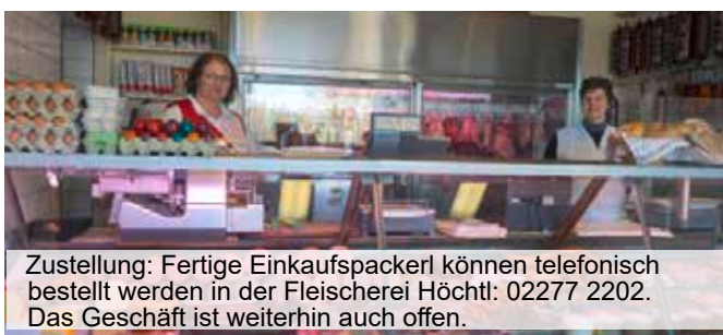
Zustellung: Fertige Einkaufspackerl können telefonisch bestellt werden in der Fleischerei Höchtl: 02277 2202. Das Geschäft ist weiterhin auch offen.