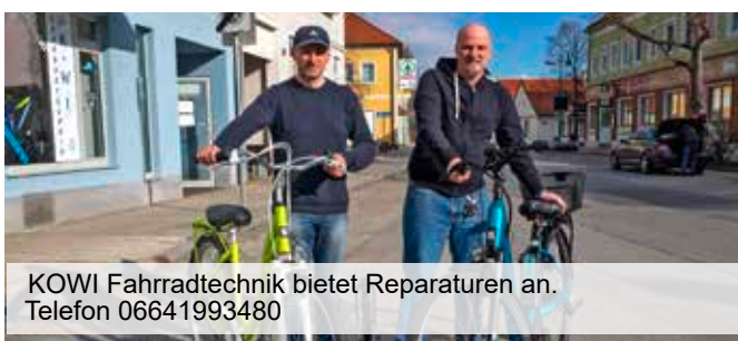
KOWI Fahrradtechnik bietet Reparaturen an. Telefon 06641993480