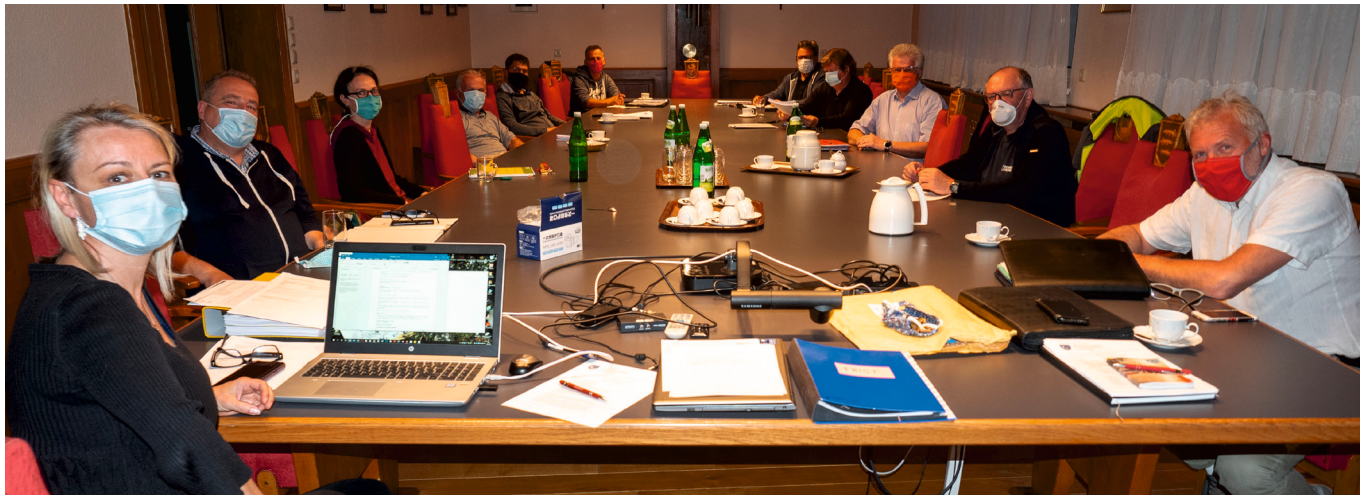
Erste Besprechung und Gedankenaustausch im Gemeindeteam. Natürlich mit Abstand und Maske. 29. April 2020

Diese Krise zeigt uns auch auf, dass es ohne staatliche Hilfe nicht geht. Alles zu privatisieren ist nicht zielführend! Die Schulden soll der Staat, sprich wir Steuerzahler_innen, be-rappen, und die Gewinne teilen sich die Aktionär_innen. Es ist prognostiziert, dass ein Drittel der Gemeinden in Öster-reich durch die Corona-Krise nicht mehr die laufenden Aus-gaben decken können. Wir sind aufgrund der umsichtigen Finanzpolitik der letzten Jahre und der Betriebe in der Ge-meinde erfreulicherweise nicht so stark betroffen, trotzdem kann dieses System langfristig nicht funktionieren.