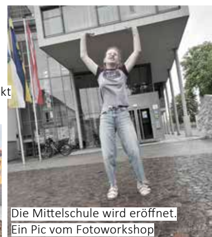
Die Mittelschule wird eröffnet. Ein Pic vom Fotoworkshop