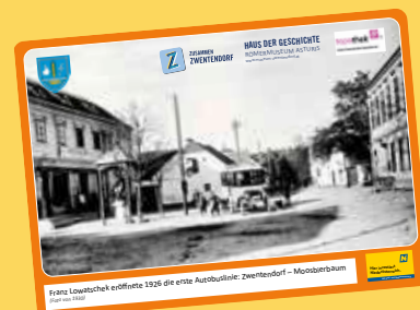
1926: Erster Busverkehr 1926: die erste Autobuslinie: Zwentendorf – Moosbierbaum