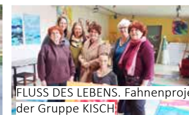
FLUSS DES LEBENS. Fahnenprojekt der Gruppe KISCH!