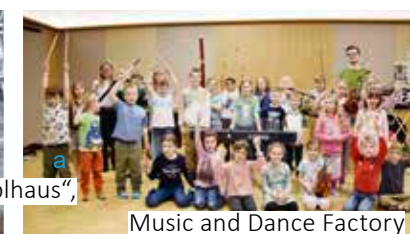
Music and Dance Factory